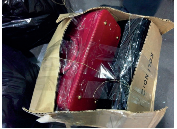
المضبوطات إثر عملية لمصلحة حماية الملكية الفكرية في وزارة الاقتصاد