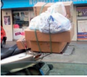
بيع الادوية على الدرجات النارية

لبنان في مجال برامج الحاسب الالى. في الجلسة الثالثة، عرض العقيد عبدالله عبد الرحمن بن سلطان تجربة شرطة دبي في حماية حقوق الموظف الفكرية إنطلاقاً من كونها قيمة استراتيجية. فيما تحدثت رئيسة الجمعية اللبنانية لتكنولوجيا المعلومات الدكتورة منى جبور عن الجوانب القانونية للسلامة والامن في الفضاء السيبراني. وشرح المحامي وليد ابو فرحات اهمية الادارة الجماعية في محاربة القرصنة من خلال التقنيات الرقمية على ضوء قوانين الملكية الفكرية.