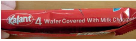
نفس صنف الشوكولا

«للماركة المسجلة أولويتها في الحماية من أي منافسة تقليداً أو تشبيهاً»