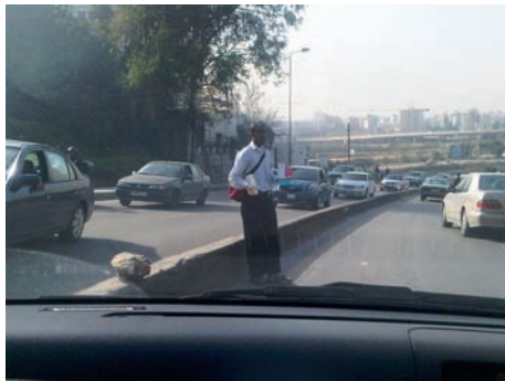
بيع عطور مقلدة على الطرقات

بناءً على شكوى من شركة عالمية متخصصة في انتاج مستحضرات التجميل وبيعها، اوقف مكتب مكافحة جرائم المعلوماتية وحماية الملكية الفكرية مدعى عليه اثناء قيامه بتوصيل طلبية من مستحضرات تجميل تحمل علامات مقلدة للشركة المدعية. وتبين في المحاكمة ان الموقوف لم يكن قد مضى على عمله لدى مدعى عليه ثان سوى اسبوع، وانه كان يجهل ان البضائع التي كان يوصلها مقلدة فقد كان يستلم من الاخير اكياساً كل منها مخصص لزبون يوصلها ويستلم ثمنها.