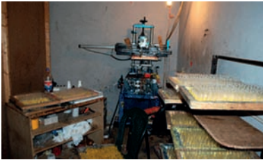
دهم مطبعة في علي النهري وضبط أدوية مزورة ومنشطات